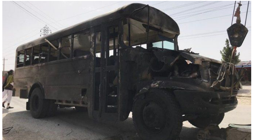
إحراق حافلة كانت تقلّ عناصر من ميليشيا طالبان بتفجير عبوة ناسفة في (بلخ)