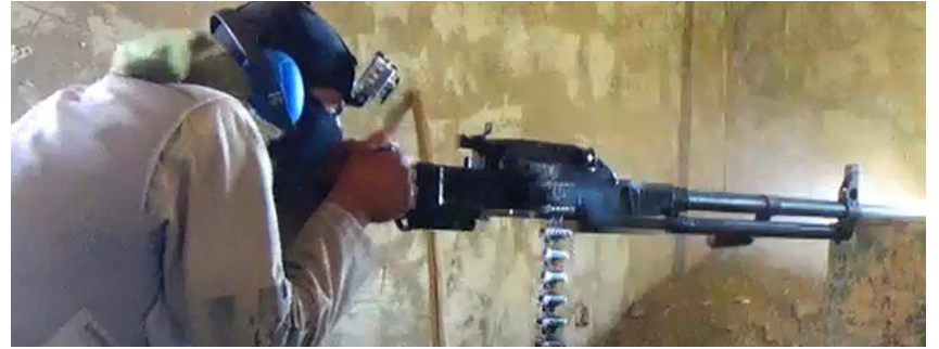
النبأ ولاية الشام - البركة